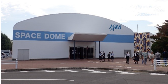
「展示館」スペースドーム