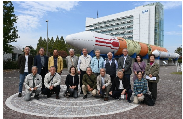
H-IIロケット (実機・全長50m)