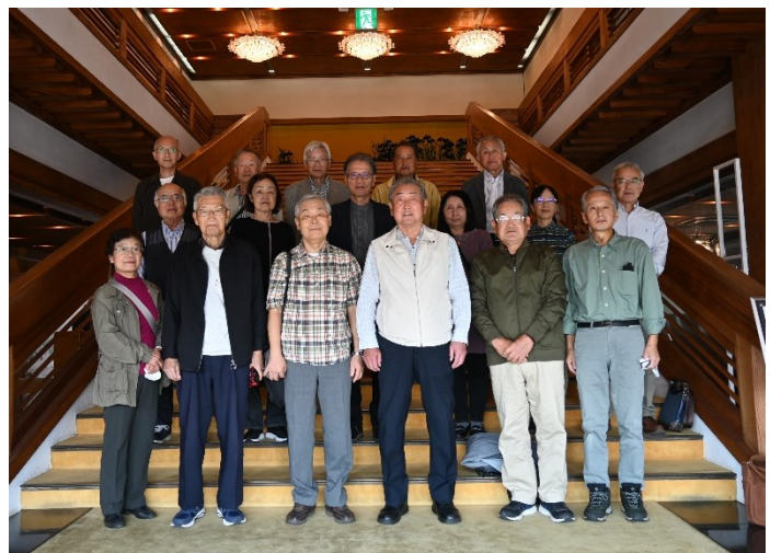
どこかで見たことのある？記念写真