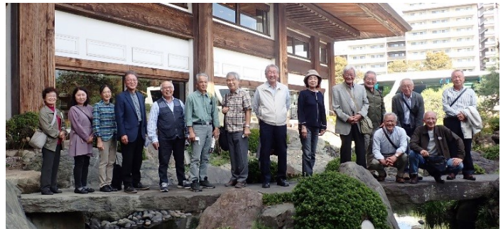
(昼食場所)ホテルグランド東雲 前庭にて