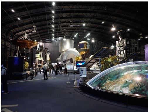
スペースドーム・入口付近