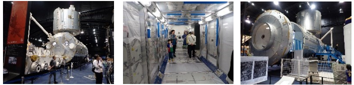
「きぼう」日本実験棟・実物大模型